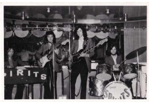
Spirits actuant al creuer danés Dana Corona, en abril de 1974.

Vam fer mosatros tamé, que me s'olvidava, en Spirits, cruceros, per ahí, per tot el món. Sí, sí, encara tinc ahí... mira, açò ho havia tret pa que... no, perquè era curiós i jo dic, xa pues li ho ensenyaré, perquè mira, este era del crucero Ybarra. Açò era tots els dies. Mira. Ahí fica les fetxes i fica... mira, veus?, mira, Spirits.